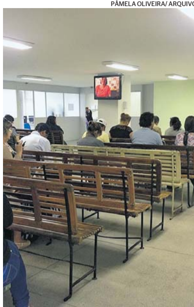
Posto de perícia médica

cidade temporária ou para concessão de aposentadoria por invalidez. O texto seguiu para o governador em exercício, Cláudio Castro, que terá até 15 dias úteis para decidir pela sanção ou veto. O objetivo é facilitar o acesso dos servidores que moram em cidades que não têm órgão estadual responsável pela perícia médica.